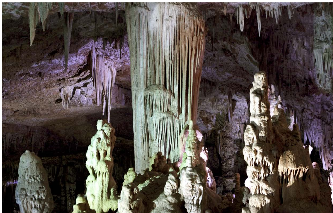
LA GROTTÉ REGORGE DE CONCRÉTIONS GIGANTESQUES , ces formations minéralogiques plus connues sous le nom de stalactites et stalagmites. Au centre de la photo, une importante concrétion, appelée draperie, parfaitement conservée malgré les siècles qui passent.

Ouverte au public le 1 er juin, la grotte de la Salamandre, située sur le plateau de Méjannes-le-Clap, est un lieu majestueux. L'immense salle souterraine est parfaitement conservée. Elle abrite des concrétions, stalactites et stalagmites, restées intactes malgré les siècles.