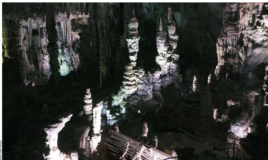
LA SALLE MONUMENTALE DE LA GROTTÉ DE LA SALAMANDRE 50 mètres de haut sur 100 mètres de large. Un passage, en contrebas, permet aux visiteurs de s'aventurer au cœur du site. 200 puissants projecteurs, aux couleurs et à l'intensité variables, sont pilotés par des automates pour offrir aux spectateurs des tableaux différents.